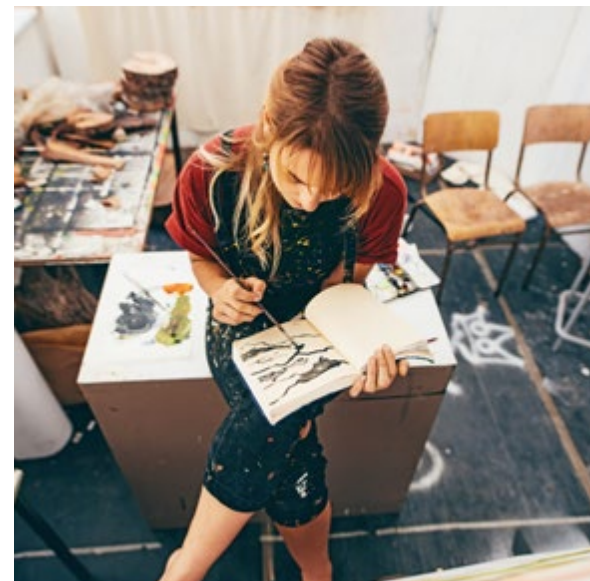
RAUM FÜR KONTRASTE, KUNST UND KREATIVITÄT