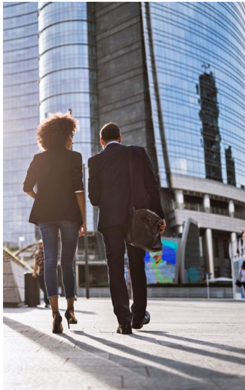
SITZ DER GROSSEN FINANZINSTITUTE: DAS FRANKFURTER BANKENVIERTEL