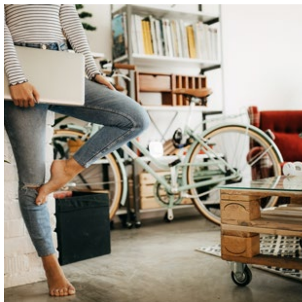
EIN ORT ZUM ENTSPANNEN, LEBEN UND ARBEITEN