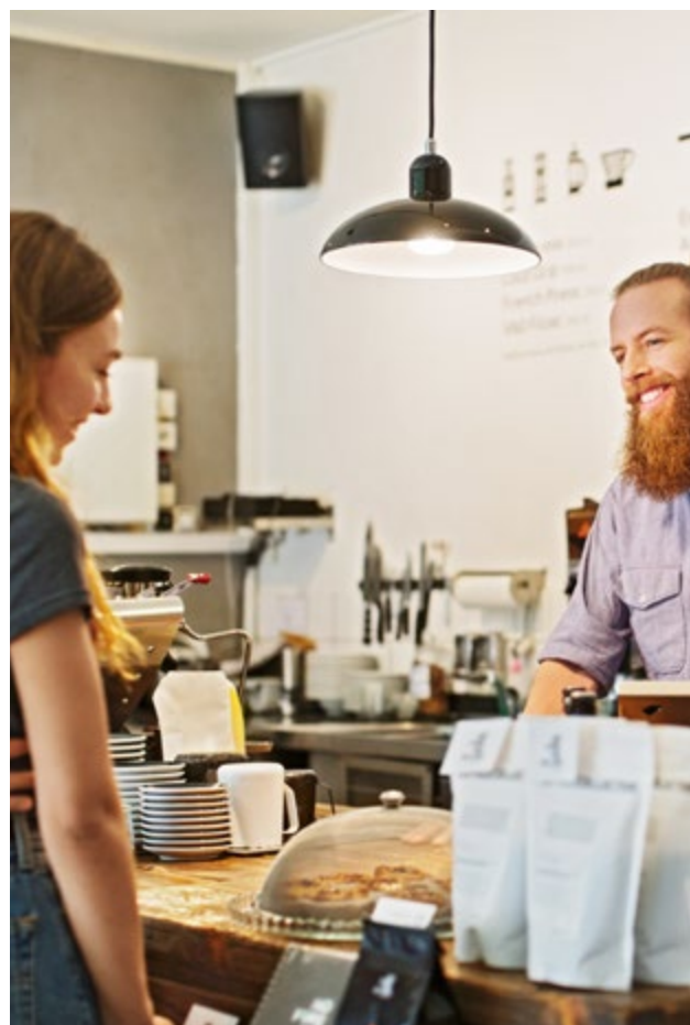
JEDER AUGENBLICK EIN SCHÖNER MOMENT

DAS ENSEMBLE TEILT SICH IN ZWEI BAUABSCHNITTE, DIE NACHEINANDER REALISIERT WERDEN. DEN ANFANG MACHEN DIE HIER IN GELB MARKIERTEN HÄUSER 4 BIS 8 (BAUABSCHNITT 1).